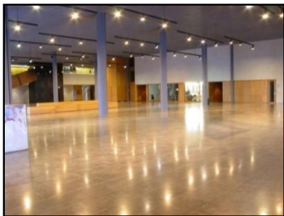
Imagen – Palacio de Congresos y Exposiciones de Galicia